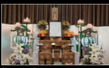
[祭壇(有料)] 供花のアレンジも承ります