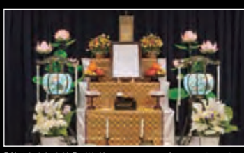
[祭壇(有料)] 供花のアレンジも承ります