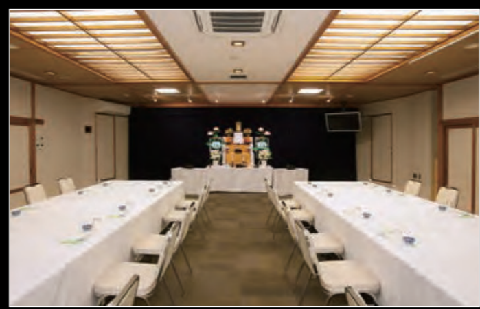
[大会場] 30~50名様収容(祭壇有料)

[収容人数]最大50名 [駐車場]有り [宿泊]対応可 御本尊・供花・供物(果物・菓子)・ ご焼香も出来ます。 ※祭壇各宗派でご準備できます。 ※祭壇・引き出物・お菓子はオプション となります