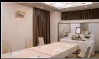
[小会場] 最大00名様収容