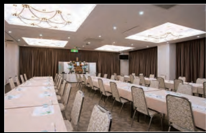
[大会場] 40~60名様収容(祭壇有料)

[収容人数]最大60名 [駐車場]有り [宿泊]対応可 御本尊・供花・供物(果物・菓子)・ ご焼香も出来ます。 ※祭壇各宗派でご準備できます。 ※祭壇・引き出物・お菓子はオプション となります