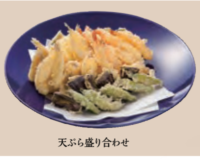
天ぷら盛り合わせ