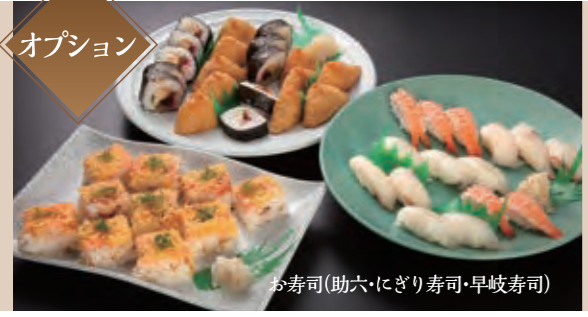
お寿司(助六・にぎり寿司・早岐寿司)