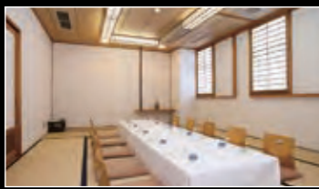
[小会場] 最大00名様収容